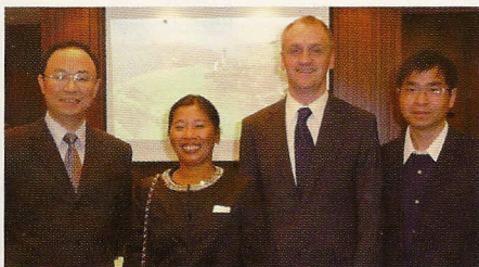
Delegationsreise nach Shanghai im November 2011